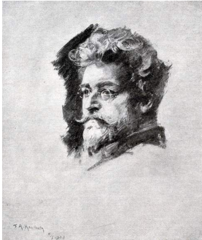
LUDWIG GANGHOFER (1855-1920)

Fabella paschalis a Ludovico Ganghofer scripta